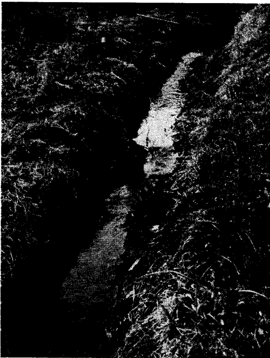
土の土手の残る小川・町田市山中

背後の丘陵は非常に浅い。もう少し先へいくと稜線になって、そこを超えれば別の流域に入ってしまう。